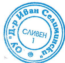
ГРАФИК НА РОДИТЕЛСКИ СРЕЩИ – М. НОЕМВРИ, 2016 г.